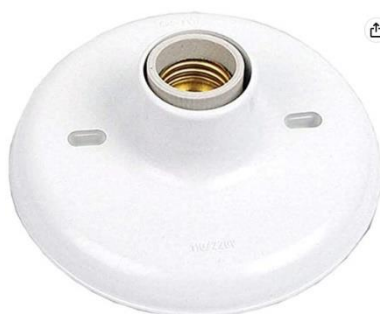
Plafonier com soquete de porcelana branco

Os pontos de iluminação devem ser todos com plafonier com soquete de porcelana branco para lâmpadas modelo E27, conforme imagem abaixo